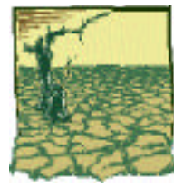
Figura 5 Erosão dos solos

1. A sequência de figuras 1 a 5, ilustra o desenvolvimento de um problema ambiental relacionado com o cultivo do tabaco: a erosão dos solos.