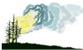
Figura 6 Incêndios

3. As figuras 6 e 7 representam dois problemas ambientais relacionados com a utilização dos cigarros pelos fumadores: os incêndios e o efeito de estufa ou aquecimento global. O efeito de estufa consiste, de forma muito resumida, na elevação da temperatura da terra provocada pelo aumento da concentração dos gases de estufa, designadamente de CO 2 e Metano, na atmosfera.