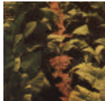
Figura 3 Crescimento do tabaco