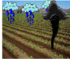
Figura 2 Plantação de tabaco