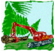
Figura 1 Desflorestação

Todos reconhecem que fumar causa graves problemas à saúde e à economia, no entanto, são em menor número as pessoas que têm consciência que o cultivo, transformação e utilização do tabaco tem um impacto profundamente negativo no ambiente.